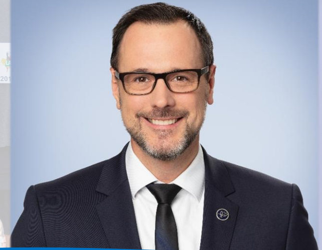
JEAN-FRANÇOIS ROBERGE DÉPUTÉ DE CHAMBLY À L'ASSEMBLÉE NATIONALE